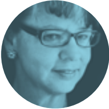
PIEDAD BONNETT 31 DE OCTUBRE | 20.00H