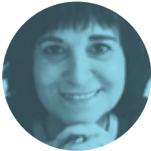
ROSA MONTERO 26 DE OCTUBRE | 19.00H

El periodista Antón Castro (Premio Nacional de Periodismo Cultural) entrevista al escritor Juan Manuel de Prada para buscar, más allá de lo que se conoce, algunas claves de la personalidad literaria del autor de Mirlo blanco, cisne negro , sus impresiones sobre otros autores y sobre los «ámbitos de poder» de la literatura.