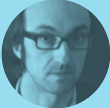
AGUSTÍN FERNÁNDEZ MALLO 28 DE OCTUBRE | 22.00H

Aquello que leemos nos conforma como individuos de múltiples maneras. Pero también confecciona al escritor, modula su mirada y su propia condición de habitante de una o varias realidades. Fernanda Trías (ganadora del primer Premio Residencia SEGIB-Eñe-Casa de Velázquez para autores iberoamericanos) y Patricio Pron, dos escritores de tradición distinta con voz propia y un contexto de referencias ancho, dan las claves de su «ideario» de lectores, que también puede ser un modo de hablar de la propia escritura.