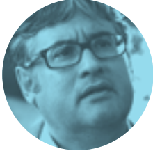
JUAN MANUEL DE PRADA 25 DE OCTUBRE | 20.00H

El teatro plantea preguntas que no tienen respuesta. Para eso hay que reservar también el escenario. La fascinación que nos produce una creación artística es tanto mayor cuanto más lejos estamos de las convicciones que la sustentaron. Del teatro siempre estamos cerca y lejos. Estas son algunas cuestiones que estimulan el pensamiento de un autor necesario en la escena española contemporánea y de un pensador que ha hecho del teatro, con su primer monólogo dramático, un nuevo cobijo contra la tormenta.