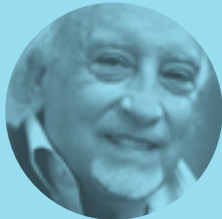
MANUEL VICENT 28 DE OCTUBRE | 20.15H